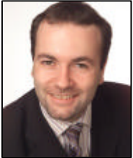
Manfred Weber, MdEP

Die Sicherheit unseres Landes und unser Beitrag zu Frieden, Freiheit und Sicherheit in Europa und in der Welt verpflichten uns, die Diskussion zur Zukunft der Wehrpflicht jetzt zu führen. Mit ihrem Engagement in dieser Frage kommen die Junge Union und der Arbeitskreis Außen- und Sicherheitspolitik der CSU dieser Verpflichtung nach.