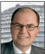
Christian Schmidt, MdB

Die Sicherheit unseres Landes und unser Beitrag zu Frieden, Freiheit und Sicherheit in Europa und in der Welt verpflichten uns, die Diskussion zur Zukunft der Wehrpflicht jetzt zu führen. Mit ihrem Engagement in dieser Frage kommen die Junge Union und der Arbeitskreis Außen- und Sicherheitspolitik der CSU dieser Verpflichtung nach.